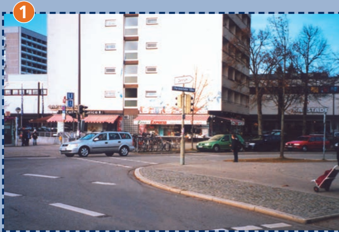
Übergang Forstenrieder Allee