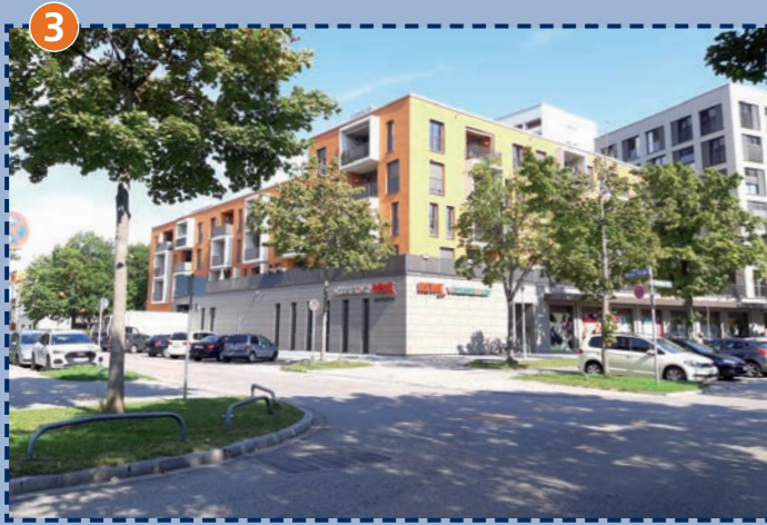
Übergang Berner Straße