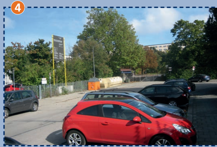
Kurve am Eingang Berner Straße