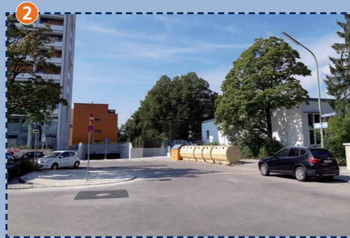
Ecke Schaffhauser Straße/Winterthurer Straße