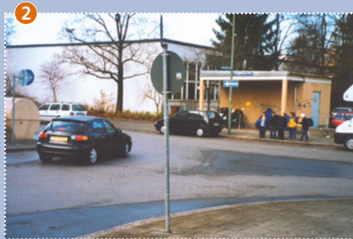
Ecke Schaffhauser-/Winterthurer Straße