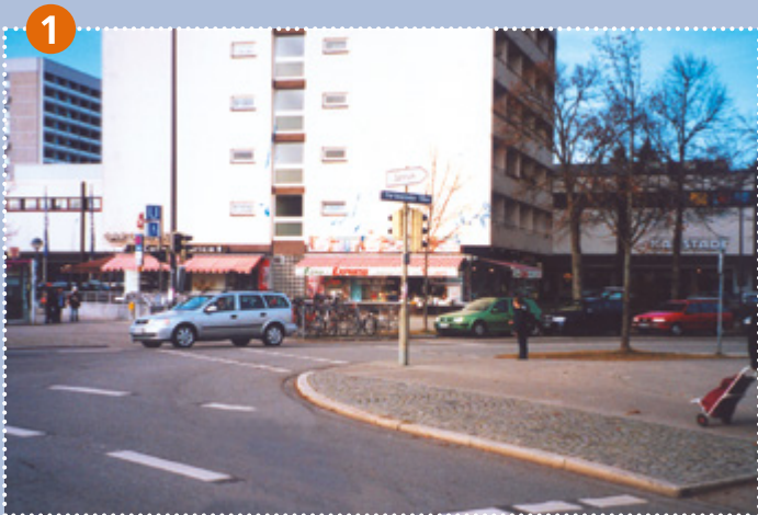
Übergang Forstenrieder Allee