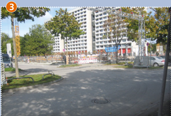
Übergang Berner Straße