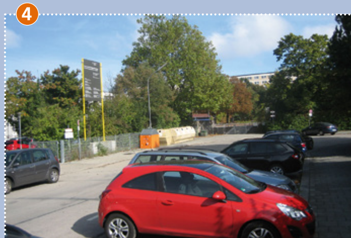
Kurve am Eingang Berner Straße